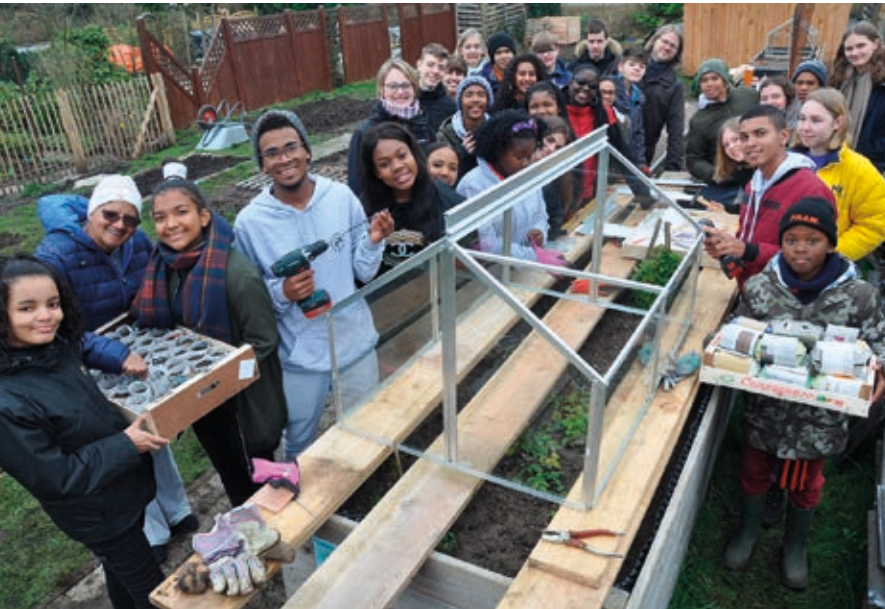
Der Schulgarten in Oldenburg