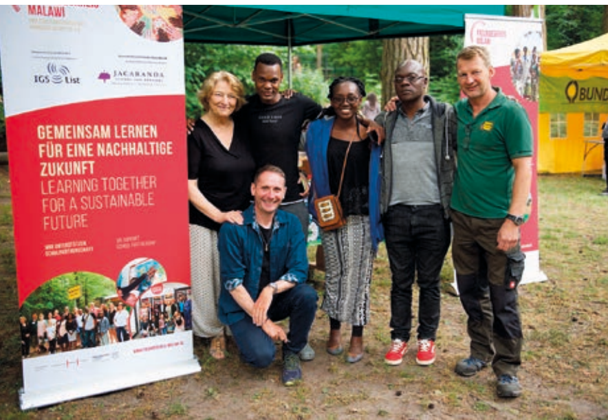
Partner*innen aus Blantyre und Hannover stellen ihre Arbeit vor.