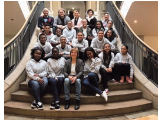
Südafrikanische Gäste in Deutschland 2019

www.t1p.de/partnerschaft-schafft-energie