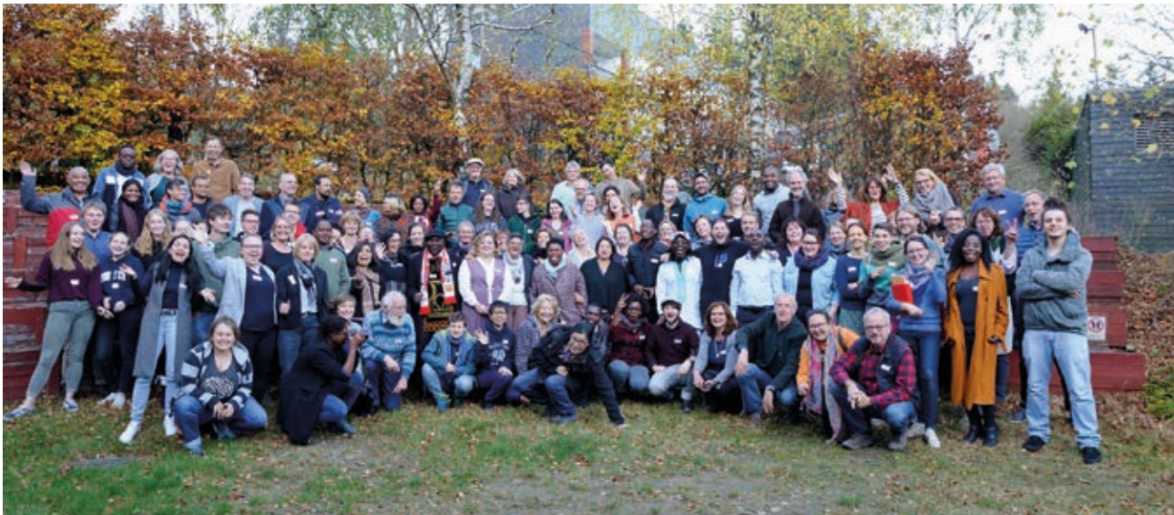
Gruppenbild: Organisator*innen und Teilnehmer*innen der „Connect for Change“-Konferenz im Herbst 2019

Textzeilen aus einem Lied, das während der „Connect for Change“-Konferenz entstanden ist.