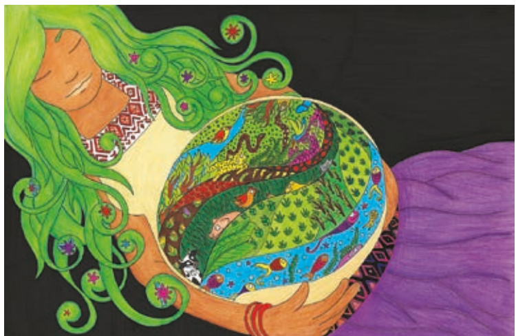
„Pachamama - Mutter Erde“ von Angie Vanessa Cardenas Roa

Am heutigen Tag des Globalen Lernens möchte ich die Bedeutung globaler Bildungspartnerschaften hervorheben. Sie waren und sind ein ganz entscheidender Teil dieser Transformation. Wir mussten uns vor 15 Jahren eingestehen, dass unsere gewohnten Denkweisen und Handlungsmuster nicht geeignet waren, Lösungen für die Zukunft zu finden. Dass wir mehr Fragen als Antworten haben und es mehr als nur eine Wahrheit und einen richtigen Weg gibt. Wir haben verstanden, dass wir weltweit gemeinsam an unseren Fragen arbeiten, voneinander lernen und mit den unterschiedlichsten Ansätzen experimentieren müssen. Wir haben erkannt, dass dabei gerade diejenigen gesehen und gehört werden müssen, deren Wissen und Erfahrungen jahrhundertlang ausgeblendet waren.