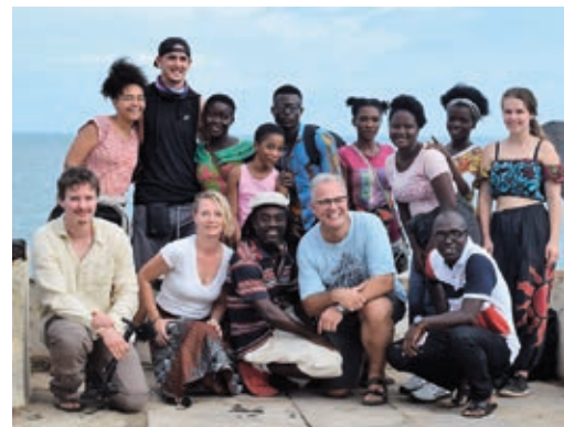
Unsere Begegnung in Ghana 2018