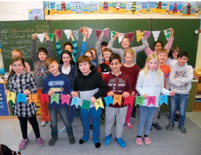
Die Schüler*innen der Grundschule Wingster Wald