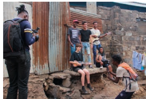
Dreh eines Musikvideos in Nairobi, Mathare. Musik und Text entstanden während der Jugendbegegnung 2019.