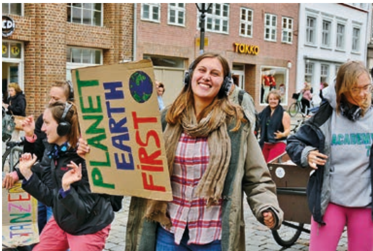
Demonstrant*innen tanzen auf einer Silent Climate Parade zur gleichen Musik über Kopfhörer gegen den Klimawandel und informieren so die Öffentlichkeit.

Bei einer als transformativ verstandenen Bildung geht es nicht nur darum, mehr Wissen zu erlangen, sondern mindestens genauso darum, unser bestehendes Wissen und unsere Sicht von und auf Welt zu hinterfragen – mitunter also um ein VERlernen bestimmter Denk-, Bedeutungs- und Handlungsmuster, die einer Transformation im Wege stehen. Es geht um eine kritisch-emanzipatorische Bildung, die Menschen unterstützt, selbstbestimmt aus den engen geistigen und emotionalen Fesseln auszubrechen, die ihnen im Rahmen ihrer Sozialisation auferlegt wurden. Es geht um eine partizipative Bildung, die experimentelle Freiräume schafft, statt Lerninhalte zu definieren. Es geht um eine liebevolle Bildung, die Talente und Vielfalt radikal wertschätzt und Neugier und Freude am gemeinsamen Lernen und Tun stärkt – jenseits normierten Leistungszwangs. Es geht um eine Weltbeziehungsbildung, die starke empathische Beziehungen aufbaut und Verbindungen schafft.