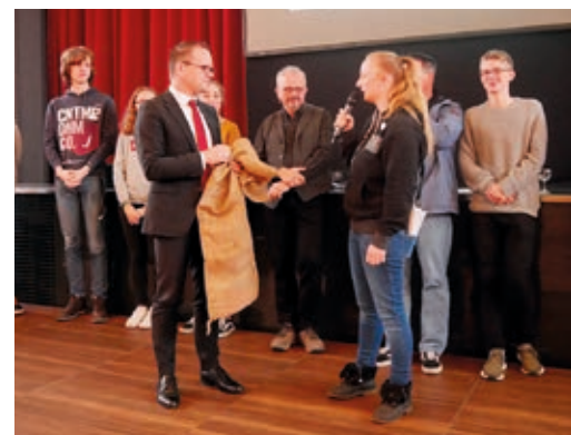
Peer-Leader übergeben Verbesserungsvorschläge für das Schulsystem an den niedersächsischen Kultusminister

Um diese Herausforderungen zu überwinden, plant PLI einen digitalen „Peer-Campus“, der zukünftig als offene Plattform für gegenseitige Informationen, Ideen und Aktionen dienen soll. So können aus kleinen Kooperationen große, wirksame Projekte für eine gemeinsame, nachhaltige Zukunft erwachsen.