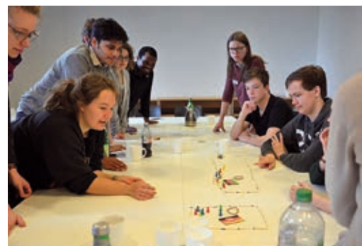
Bildungsarbeit in Deutschland