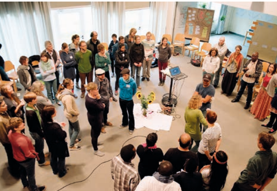
Treffen der Netzwerkmitglieder bei einer Konferenz 2017