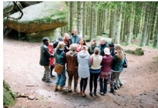
Gruppenarbeit im Freien zum Thema Nachhaltigkeit