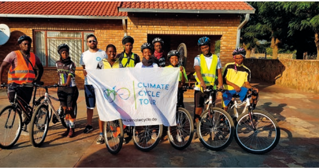
Die Climate Cycle Tour in Südafrika