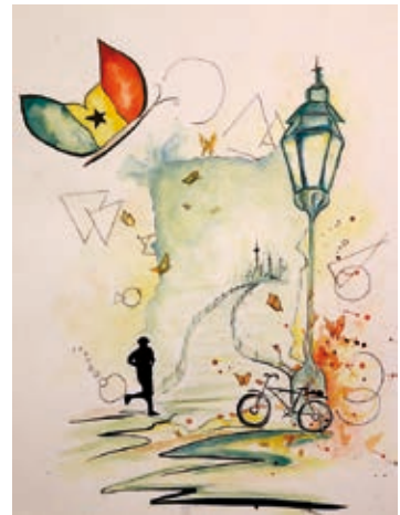
Unser gemeinsamer Weg, Zeichnung von Quynh Bui

www.ghanagermanypartnership.wordpress.com