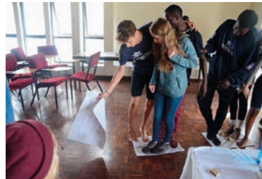
Teambuilding während der Jugendbegegnung 2019

www.partner-ueber-grenzen.de/ www.myffworldwide.weebly.com/