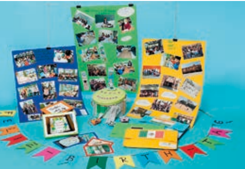
Plakate der Schüler*innen der Schule am Wingster Wald, Deutschland