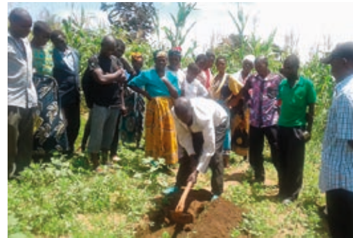
Ausbildung von Landwirt*innen in Malawi