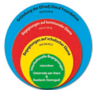
Das Osteroder Modell

www.trg-osterode.de/auslandskontakte/kaolack-senegal www.elhadj-diouf-foundation.de www.koumbisaleh.org