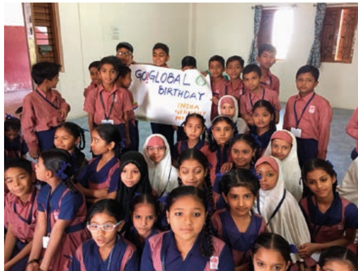
Die Schüler*innen der Grundschule in Ahmedabad