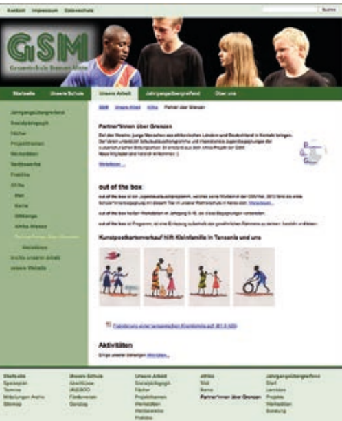
Website der Gesamtschule Bremen-Mitte, Deutschland mit Informationen zur Partnerschaft mit einem Verein in Nairobi, Kenia

Gibt es eine Website der Schule, des Vereins oder der Organisation? Neben wichtigen Informationen zum Projekt und seinen Förder*innen sollten hier auch Erfahrungsberichte zu finden sein. Vielleicht haben einige Teilnehmende auch einen eigenen Blog, in dem sie berichten wollen? Mit dem kostenlosen Programm Wordpress kann man außerdem sehr schnell eine eigene Website für das Projekt erstellen. So könnten die Berichte der Partnerorganisation auf der gleichen Plattform veröffentlicht werden. Bei gemeinsam erstellten Websites sollte stets klar erkennbar sein, wer Verfasser*in der einzelnen Texte ist. Auch hier gilt: Die Beiträge sollten eine übersichtliche Gliederung haben. Je Text sollte nur ein Thema behandelt werden, sonst wird er zu lang. Einzelne thematische Aspekte können mit Zwischenüberschriften verdeutlicht werden. Auf einer Website ist viel Platz für Fotos. Diese können z. B. in einer Fotogalerie zusammengestellt werden. Vielleicht sind auch kurze Videos entstanden, die hochgeladen werden können?