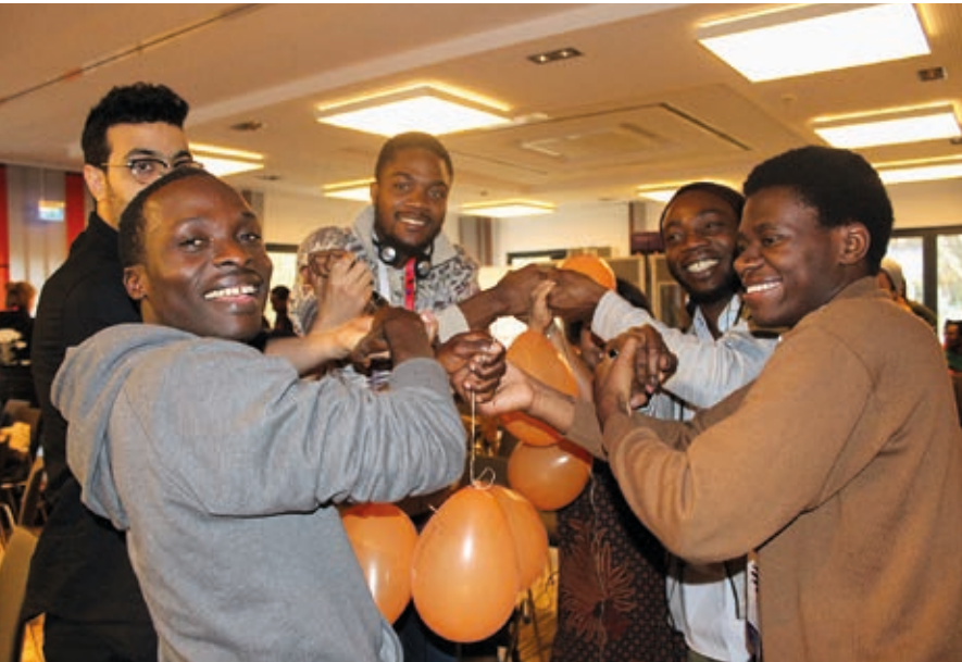
Konferenz-Teilnehmende vernetzen sich