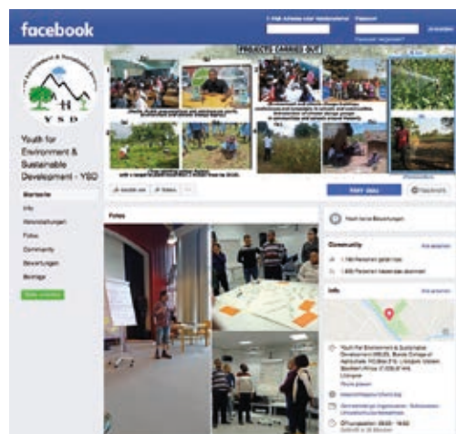
Facebook-Seite von Youth for Environment and Sustainable Development (YSD) aus Lilongwe, Malawi mit Fotos von der „Connect for Change“-Konferenz

Im Idealfall kennt jemand eine*n Medienvertreter*in, um mit ihm*ihr ein Gespräch zu vereinbaren. In einem Interview stellt er*sie Fragen und verfasst hinterher aus den Antworten einen Text, den er*sie anschließend zur Veröffentlichung freigibt. Falls es keine direkten Kontakte zu Medienvertreter*innen gibt, kann eine Pressemitteilung helfen, die Bildungspartnerschaft in der Öffentlichkeit bekannt zu machen. Journalist*innen erhalten täglich viele Informationen; deshalb ist es wichtig, ihnen gleich zu Beginn zu erklären, warum diese Information oder dieser Bericht in die Zeitung, ins Radio oder Fernsehen soll. Je weniger Arbeit der*die Journalist*in mit der Pressemitteilung hat, desto besser ist es und so wahrscheinlicher kommt man dem Ziel der Veröffentlichung näher. Dafür gilt es, die sechs W-Fragen zu berücksichtigen, beginnend mit der jeweils wichtigsten. Zitate von Beteiligten sind hier besonders wichtig. Auch ein aussagekräftiges Foto erhöht die Chance, z. B. in der Zeitung abgedruckt zu werden. Wichtig ist es, eine Ansprechperson inklusive Telefonnummer für eventuelle Rückfragen zu nennen. Die Pressemitteilung mit Fotos im Anhang wird per E-Mail verschickt. Notwendige Adressen dafür finden sich in den Impressen von Zeitungen oder auf den Websites der Medien.