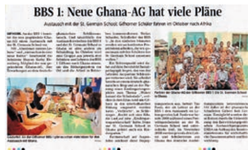
Zeitungsartikel über die Partnerschaft der BBS 1 in Gifhorn, Deutschland und der St. Germain School in Agona Swedru, Ghana