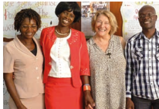
Koordinator*innen der Partnerschaft zwischen Blantyre und Hannover