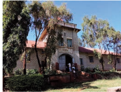
Militärbaracken aus der Kolonialzeit

www.facebook.com/msituwatembo www.t1p.de/helene-lange-schule