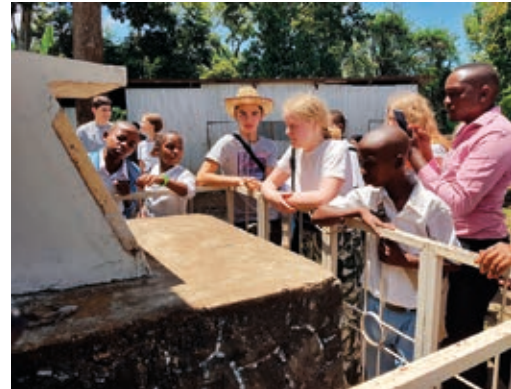
Besuch eines Denkmals für die Christianisierung