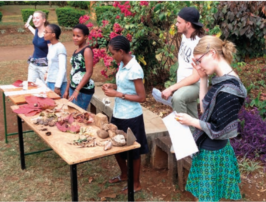
Tischtheater zum deutschen Kinderbuch „Frederick“