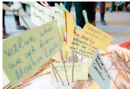
Gutes Leben, Rechte der Mutter Erde und Nachhaltigkeit - Leitthemen im Netzwerk