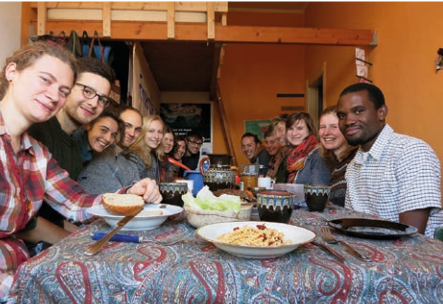
Klimabrunch in Lüneburg