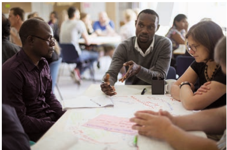
Gemeinsame Brainstormings und Diskussionen helfen, erste Ideen und Wege zur Umsetzung zu finden.